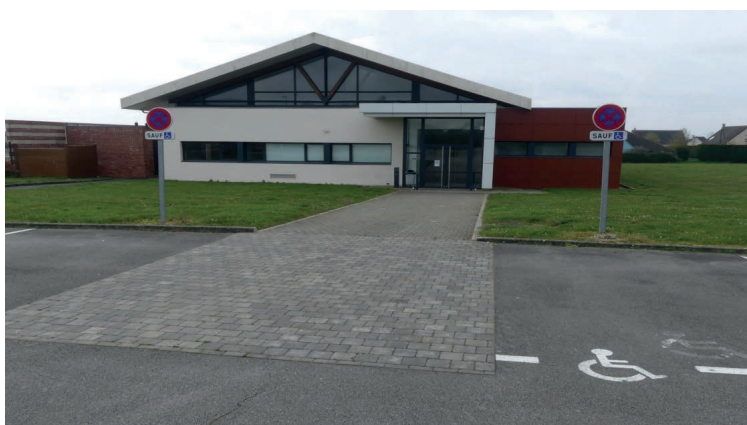
Salles des fêtes