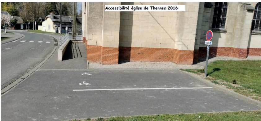
Accessibilité église de Thennes 2016