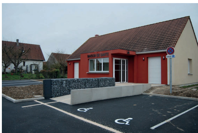
Maison de santé

Tous les aménagements réalisés depuis 10 ans ont systématiquement pris en compte l'accès aux personnes à mobilité réduite.