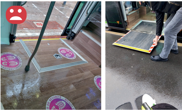
Transport : les bus sont accessibles par une rampe mais elle reste difficile d'accès et peu pratique.

Dans ce reportage photo nous faisons une mise en avant sur quelques lieux publics et transports dans lesquels il y a encore quelques problèmes d'accessibilité ou au moins de bonnes intentions, mais qui ne sont pas poussées jusqu'à avoir une bonne qualité d'usage pour que les personnes en situation de handicap puissent mieux vivre leur autonomie dans leur déplacement. Nous faisons également un retour sur les communes qui ont joué le jeu en répondant à notre appel, elles nous ont fait un retour sur les travaux de voirie effectués et montrer/démontrer que c'est possible !