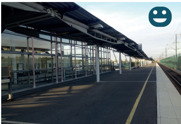
Les quais de la gare TGV Haute Picardie sont accessibles