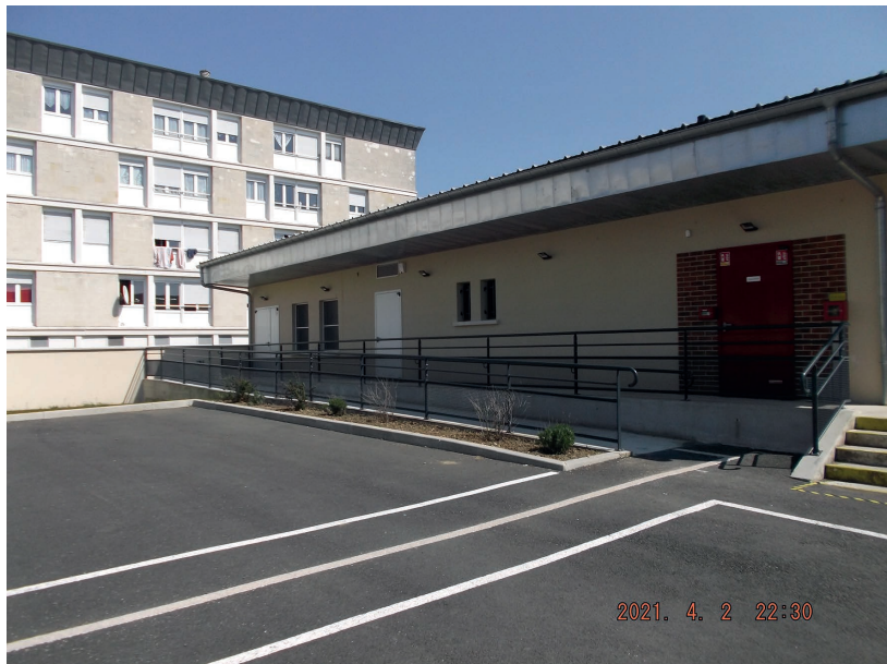
Commune de Margny-Lès-Compiègne 60280

La cantine intergénérationnelle travaux réalisés : rampe d'accès PMR Date de réalisation des travaux : 2019/2020