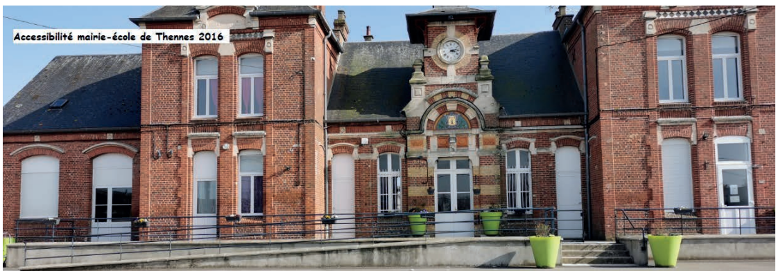
Accessibilité mairie-école de Thennes 2016

Commune de Thennes 80110 : Accessibilité de l'église et de la mairie-école