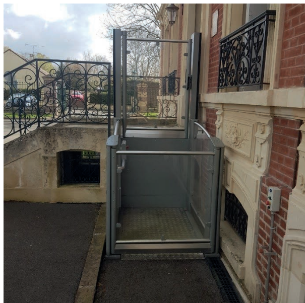
Commune de Lormaison 60110 Mairie de Lormaison. - type de travaux réalisés : Ascenseur pour personne à mobilité réduite - date de réalisation des travaux : le 11 Avril 2017.