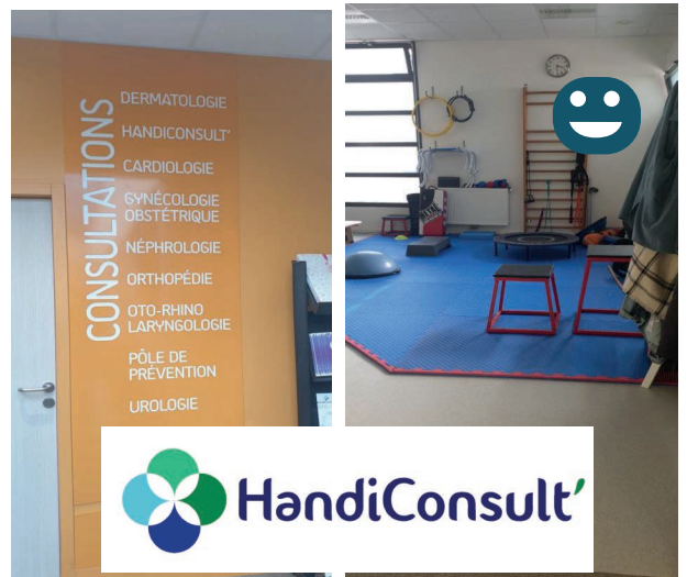
TOP : Mise en place du service d'accès à la santé Handiconsult Amiens Nord et Sud