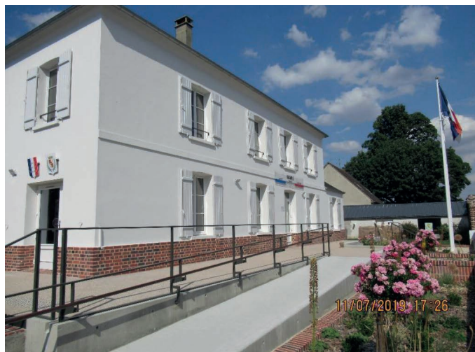
Commune de Jouy Sous Thelle 60327 Mairie accessible

La cantine intergénérationnelle travaux réalisés : rampe d'accès PMR Date de réalisation des travaux : 2019/2020